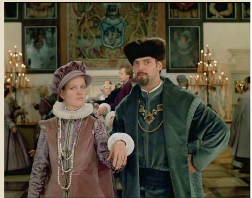
Кадры из фильма “Бориса Годунова”