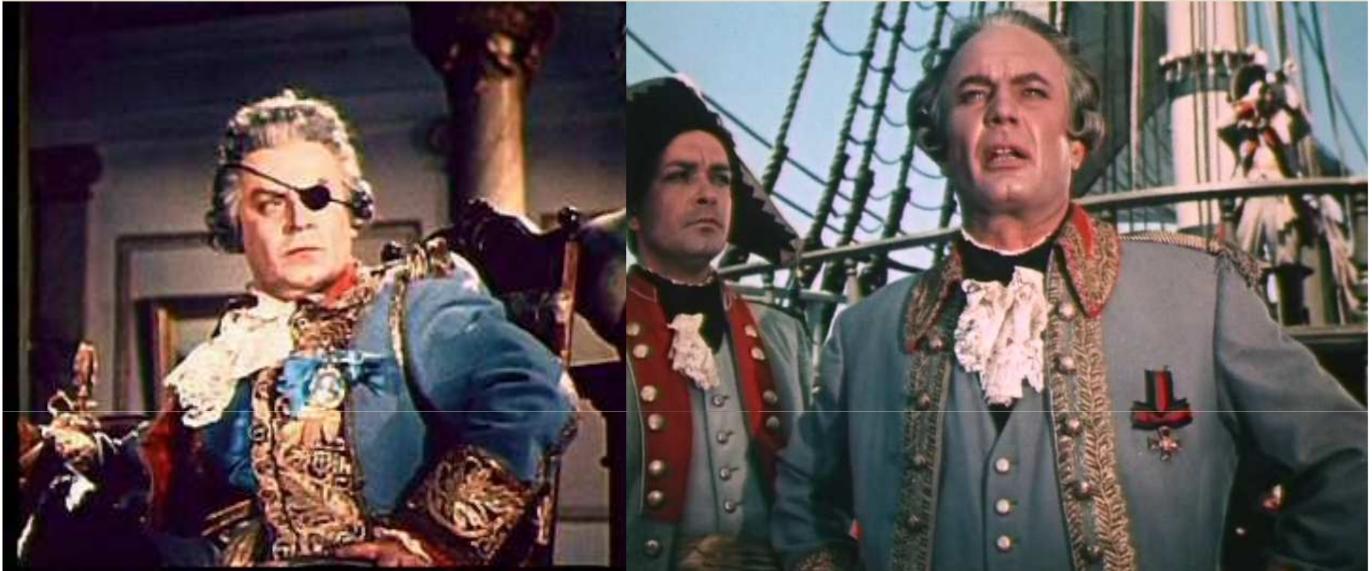
Кадры из фильма “ Адмирал Ушаков”