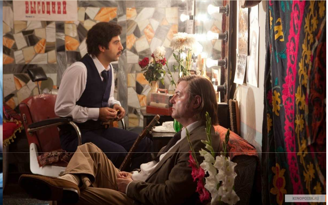
Кадры из фильма “Высоцкий: Спасибо что живой”